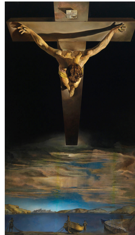
Salvador Dalí: Križanje

Ali ni ta trditev protislovna? Ko je Jezus te besede izgovoril, so ga le nekaj trenutkov zatem prijeli, bičali, obsodili ter ga na krut in sramoten način umorili. Ni bil videti kot zmagovalec, ampak zavržen poraženec. V čem je njegova zmaga? Gotovo v ljubezni in vstajenju. Ko se je po svoji volji izročil v trpljenju in smrti na križu, je sprejel nase vse zlo greha. Trpljenju je dal nov smisel, vpeljal ga je v novo