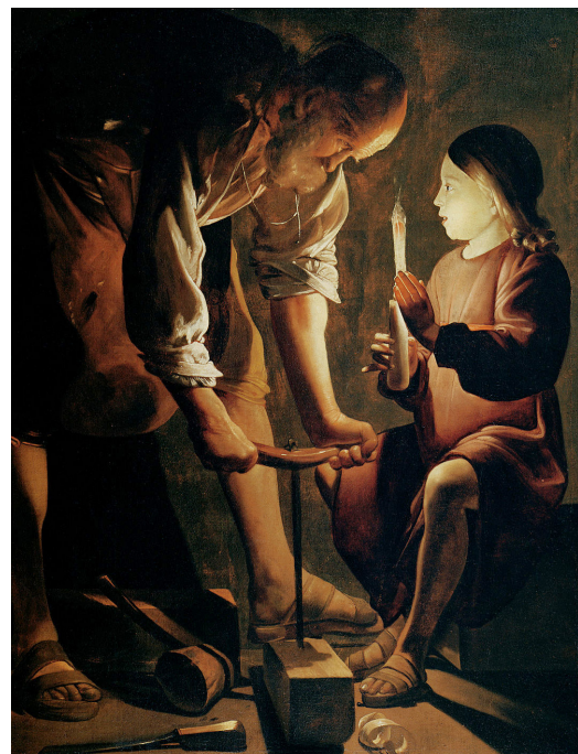
Georges de La Tour: Jožef tesar

V vsakem molitveniku najdemo kakšno molitev v čast sv. Jožefu. Posebne prošnje so nanj naslovljene ob sredah, zlasti pa celoten mesec marec, ki je tradicionalno posvečen njemu.