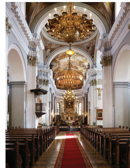
Slika: Notranjščina cerkve

Po vstopu v notranjost se pred nami razgrne bogastvo arhitekture, oltarnih slik, stropnih fresk ter baročno razgibanih angelov in svetnikov. Zaradi belo obarvanih sten, stebrov, lokov in zidnih vencev je še poudarjena kakovost cerkvene opreme, ki v polnosti zažari, ko sončni žarki v dopoldanskem času napolnijo notranjost cerkvene prostora. Bleščeča svetloba ustvarja praznično razpoloženje, kot bi nam govorila: »Duhovno načelo, ki ga uteleša svetloba, claritas, je vir sleherne lepote in znanja in neločljiva sestavina veličine arhitekture. Zakaj tri stvari ustvarjajo lepoto: najprej celovitost ali popolnost, in zato pravimo, da niso lepe nepopolne stvari; potem pravilno sorazmerje ali skladnost; in nazadnje svetloba, luč, in zares pravimo, da so lepe tiste stvari, ki so svetle. Ker dojemanje lepega prinaša mir in se naša želja enako poteši v miru, v dobroti in v lepoti, začutimo, kako nas vse preplavlja veliko veselje« (Umberto Eco).